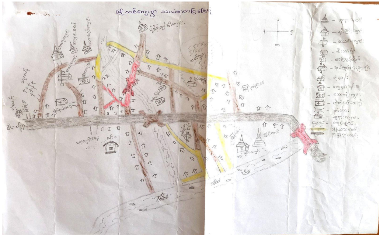
မြို့သစ်ကျေးရွာ သယံဇာတပြမြေပုံ